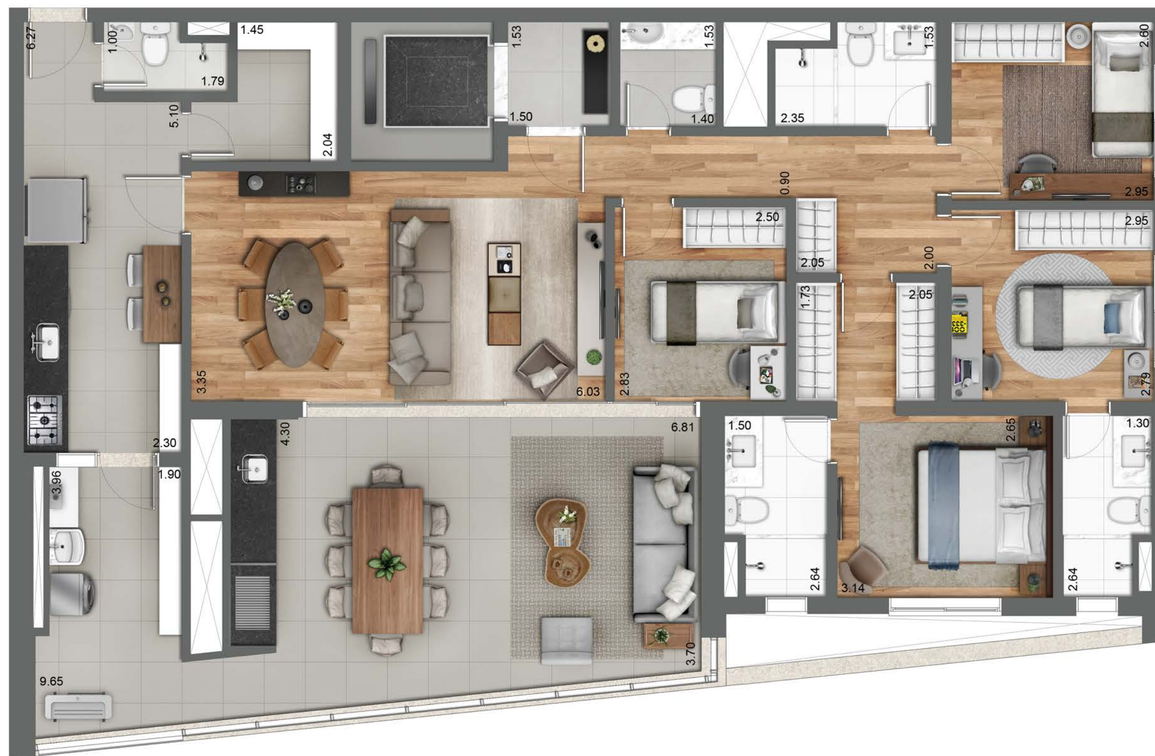
Planta ilustrada do apto. tipo de 158 m 2 (finais 1 e 3 da torre B).