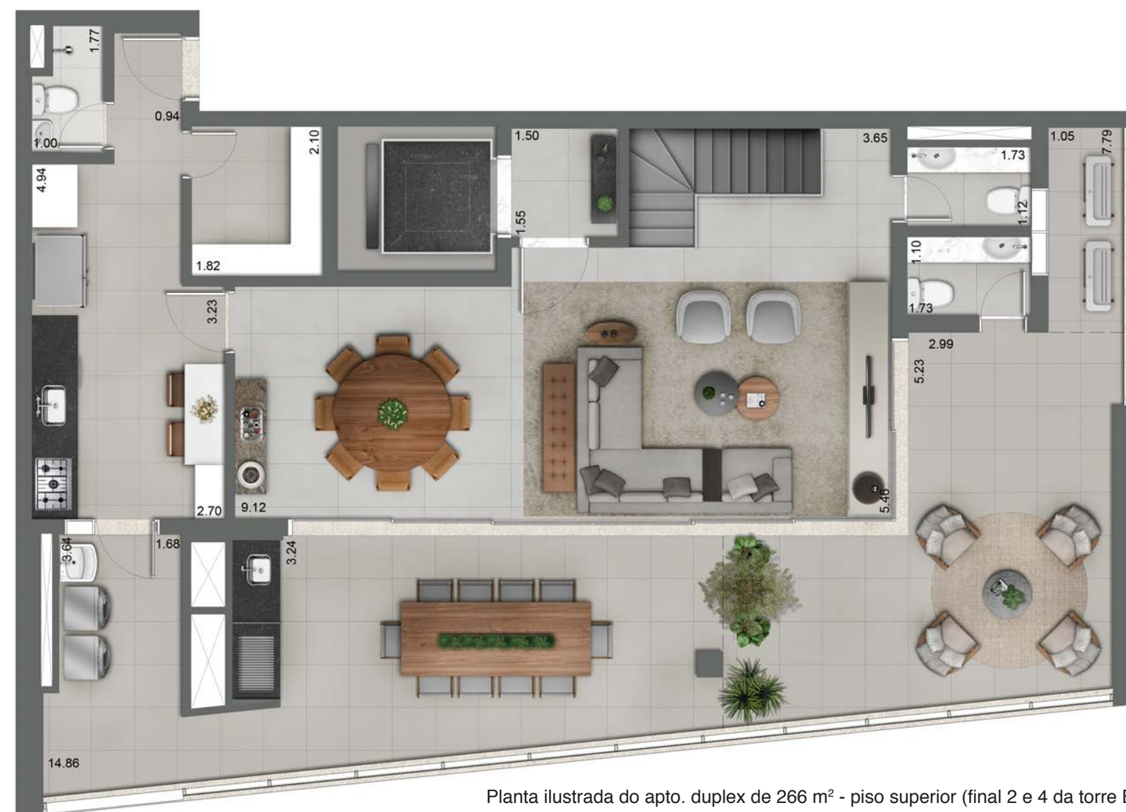
Planta ilustrada do apto. duplex de 266 m 2 - piso superior (final 2 e 4 da torre B).