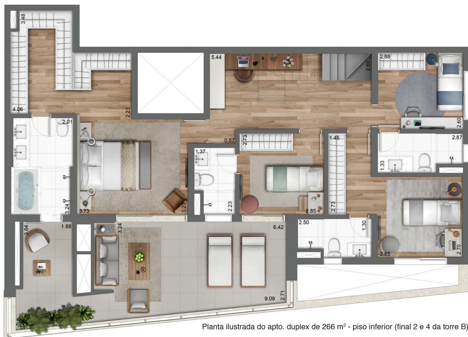
Planta ilustrada do apto. duplex de 266 m 2 - piso inferior (final 2 e 4 da torre B).