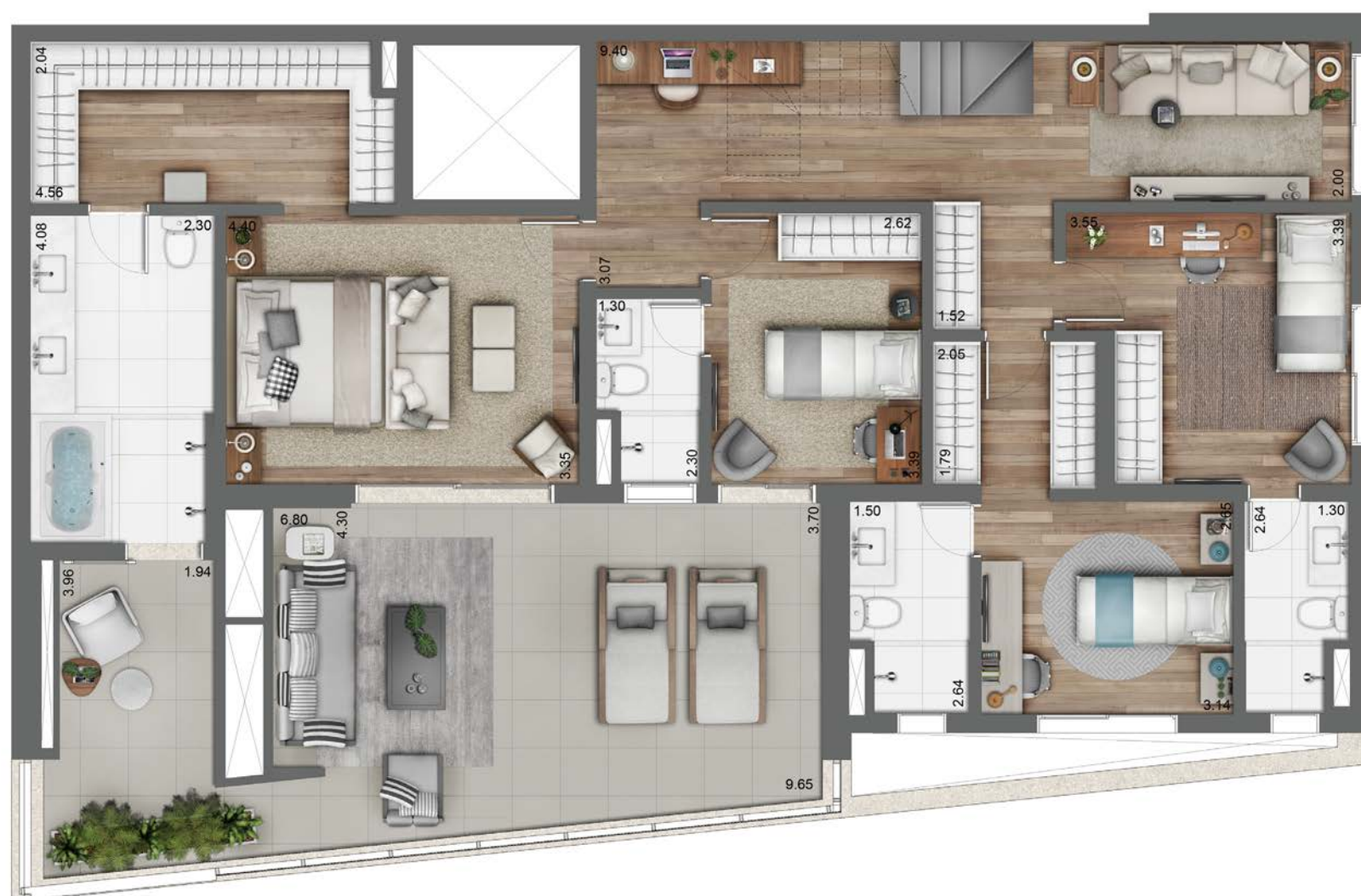
Planta ilustrada do apto. duplex de 318 m 2 - piso inferior (final 1 e 3 da torre B).