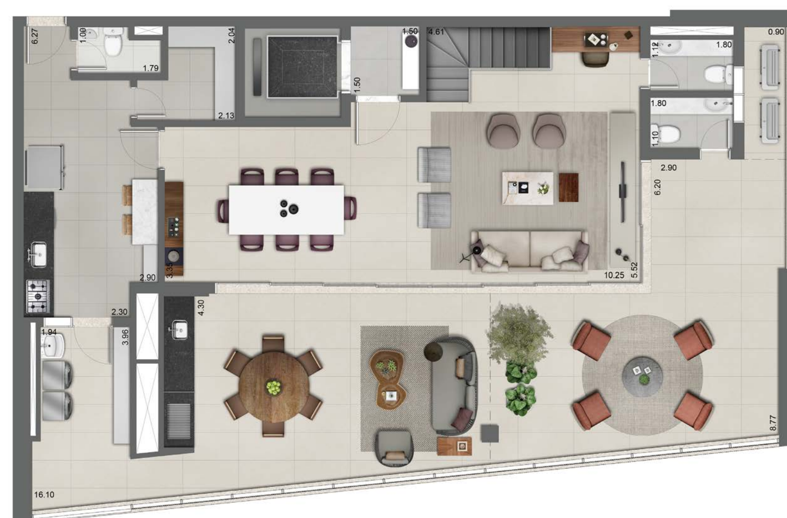
Planta ilustrada do apto. duplex de 318 m 2 - piso superior (final 1 e 3 da torre B).