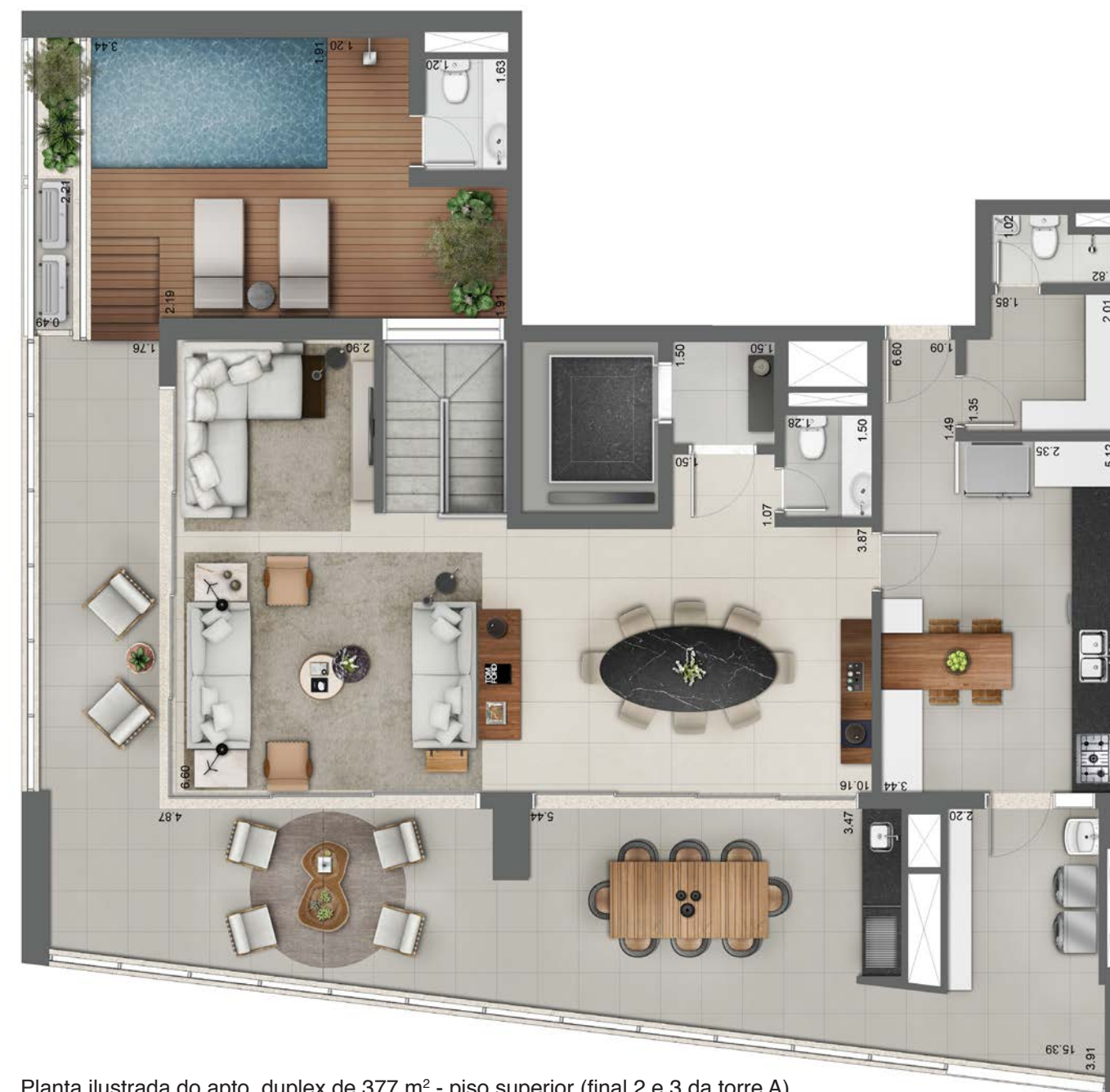
Planta ilustrada do apto. duplex de 377 m 2 - piso superior (final 2 e 3 da torre A).