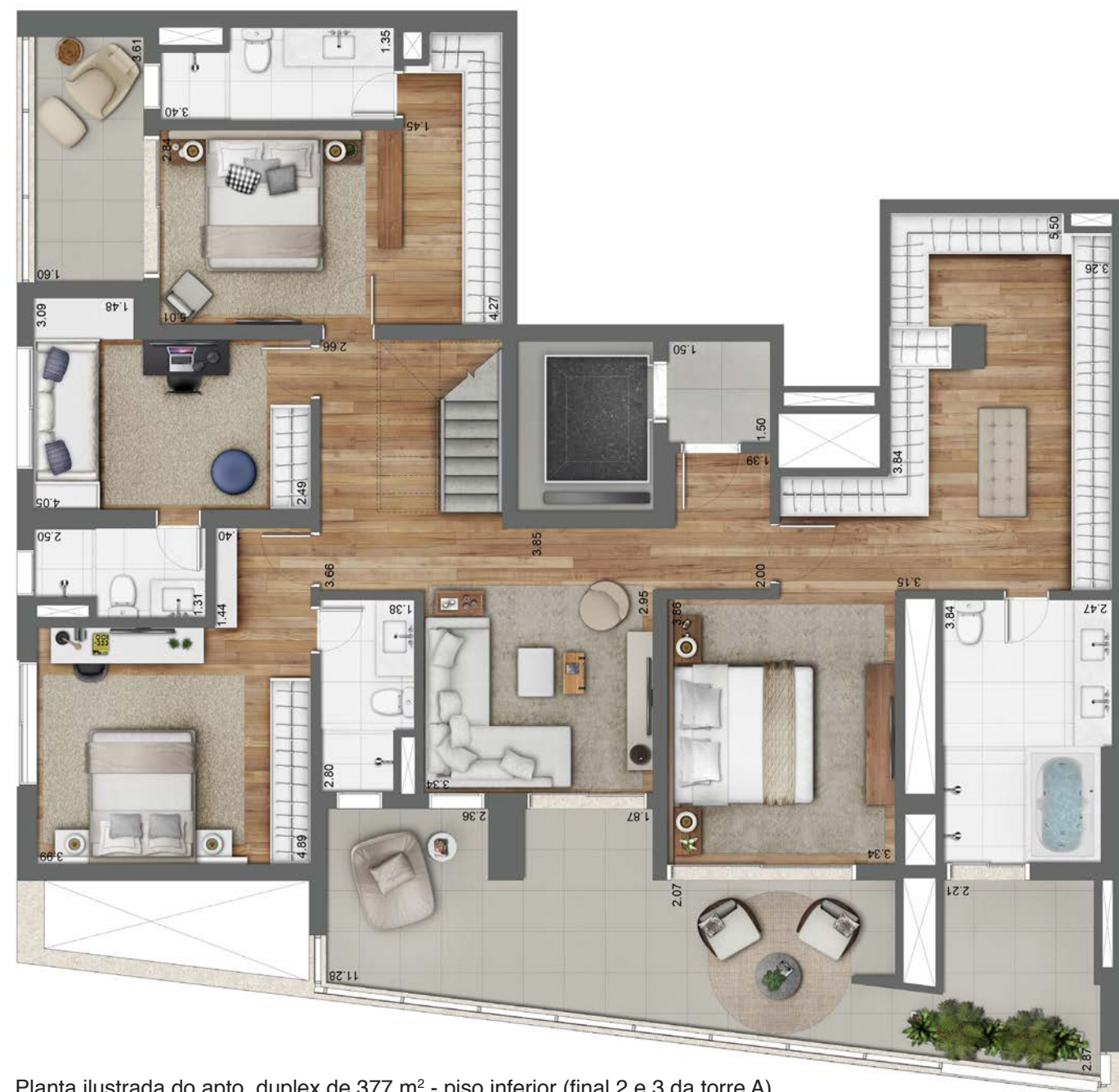
Planta ilustrada do apto. duplex de 377 m 2 - piso inferior (final 2 e 3 da torre A).