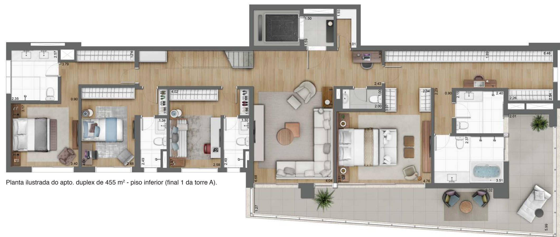
Planta ilustrada do apto. duplex de 455 m 2 - piso inferior (final 1 da torre A).