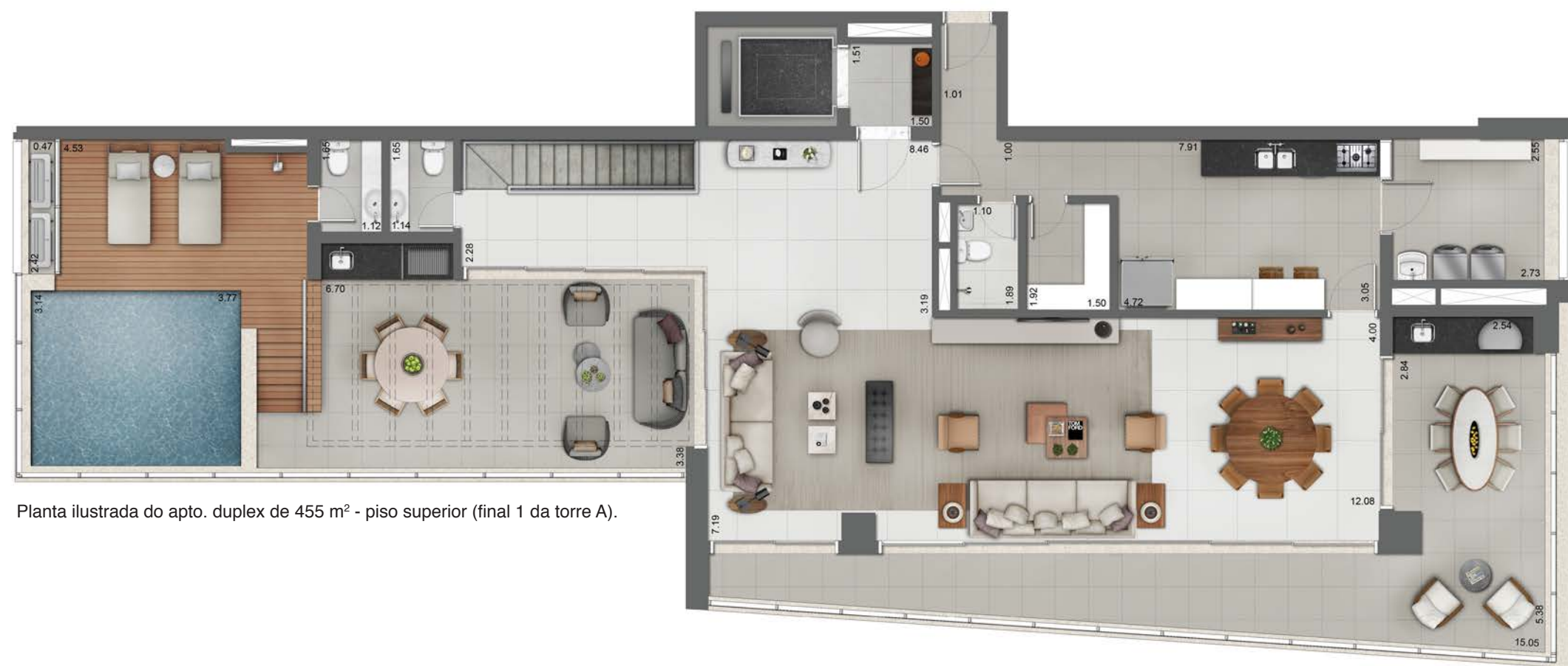
Planta ilustrada do apto. duplex de 455 m 2 - piso superior (final 1 da torre A).